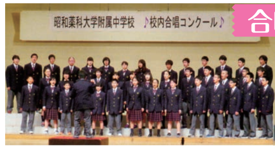
合唱コンクール (てだこホールにて)