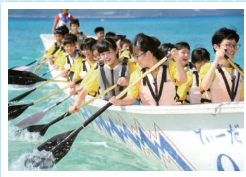
中3 渡嘉敷島海洋研修