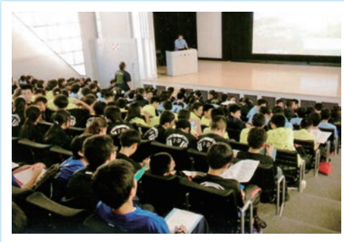
中1 平和学習の様子

また、中学2年では名護青少年の家で名護岳登山などを行い、中学3年では渡嘉敷島国立青少年交流の家でカヤックなどの海洋研修やキャンプ体験を2泊3日で行うなど、生徒の成長に応じた研修内容を用意しています。薬科生も毎年楽しみにしている一大イベントです!